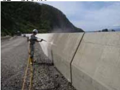
一次散水(高圧洗浄)