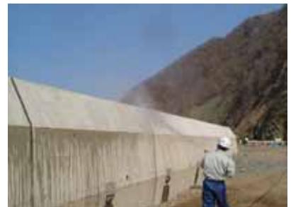
一次散水(高圧洗浄)