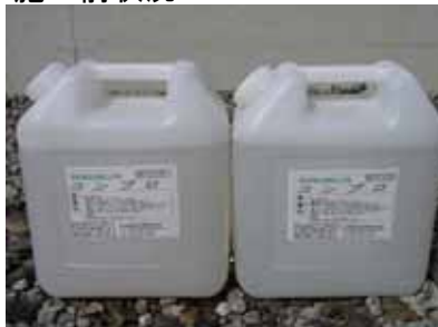
使用材料 コンプロ