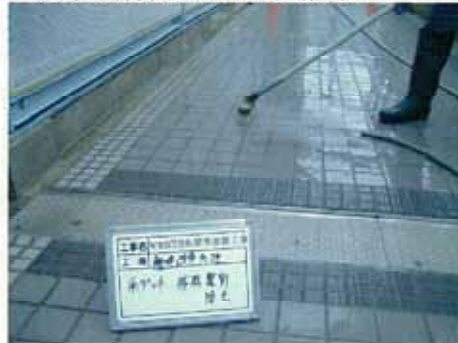
洗浄・清掃及び1回目散水