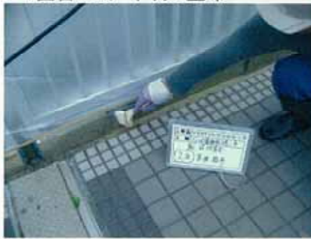
1回目RCカーデックス塗布